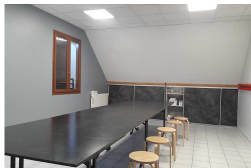
La nouvelle salle affectée aux Activités Périscolaires

Les travaux réalisés par les entreprises locales (Huet Isolation, Bertelli, Comaille RVelec) s'élèvent à 6.800 € HT.