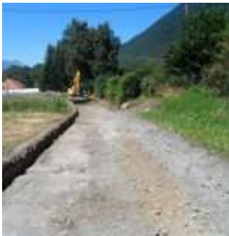
Vue du chemin Pré Badier

La durée des travaux est estimée à trois mois.