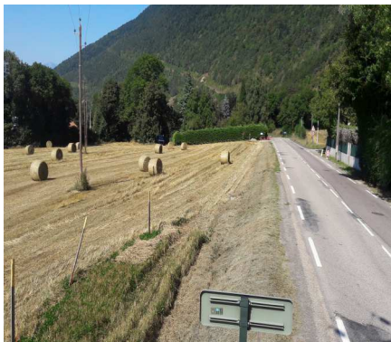
Localisation du projet