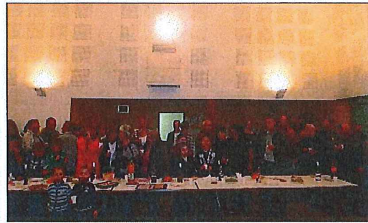
Dans la grésille de l'actualité de ce mois de novembre, une petite fleur : l'invitation du conseil municipal à fêter le beaujolais nouveau, qui a été particulièrement appréciée par les Monteynardais. Ils sont venus nombreux, jeudi, certains avec les mains pleines, à la rencontre des autres, pour une parenthèse bienvenue.