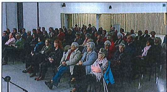
Près d'une centaine de personnes était présente en la Locomotive, pour une causerie animée par l'association de théâtre "Partage" et l'association patrimoniale des Amis de l'histoire du pays vizillois, autour de la fresque historique "Mémoires ouvrières".

À noter qu'une exposition itinérante est à voir à la mé- diathèque Jules-Vallès jus- qu'au 2 décembre, avant d'être Saint-Barthélemy- de-Séchillienne.