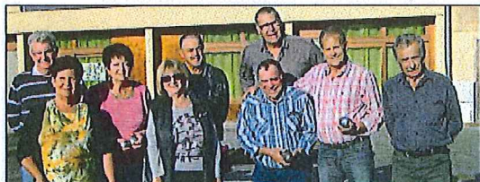
Sous le dernier soleil d'automne, le nouveau terrain de pétanque a été testé.

Les employés municipaux de Vaulnavays-le-Bas viennent de réaliser un nou- vel équipement, juste à côté du terrain de basket. C'est un magnifique terrain de pé- tanque qui a donc vu le jour